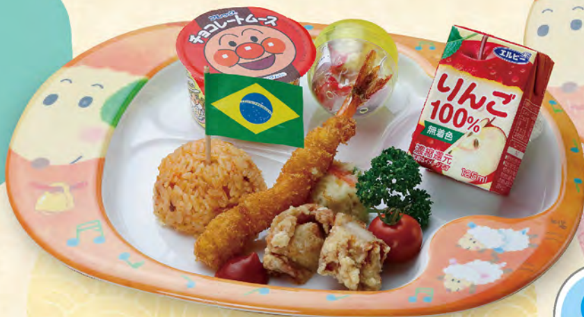
87 お子様ランチ 630円