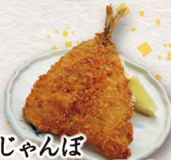
じゃんぼ アジフライ 500円