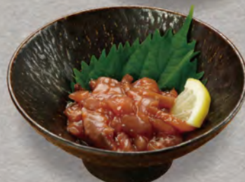
80 イカの塩辛 380円