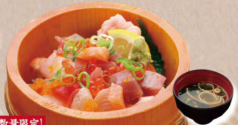
[数量限定] ちらし丼 1,680円 みそ汁付き