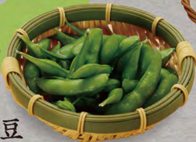
78 枝豆 380円