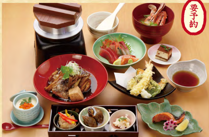
91 真鯛コース 3,500円(税込み)