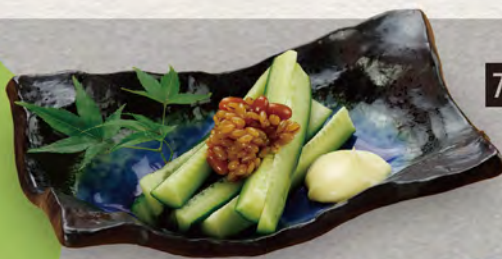
76 きゅうり スティック 280円