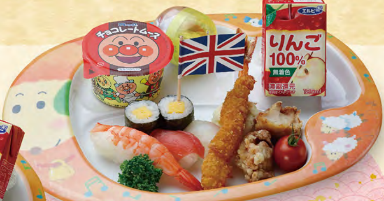
88 お子様すし 780円