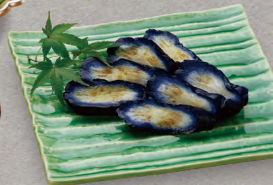
81 ナスのわさび漬け 380円