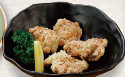
72 鶏のから揚げ 680円