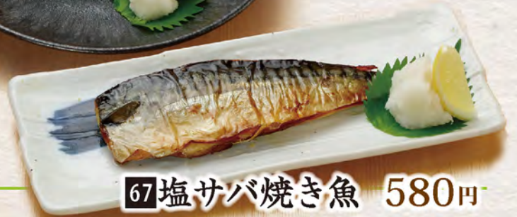
67 塩サバ焼き魚 580円