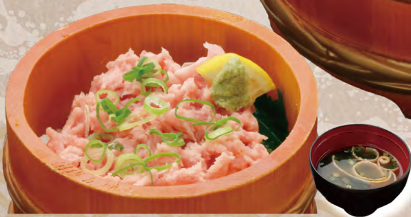
ネギトロ丼 1,580円 みそ汁付き