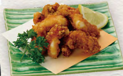
73 タコのから揚げ 480円