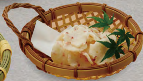
79 金目鯛チップス 380円