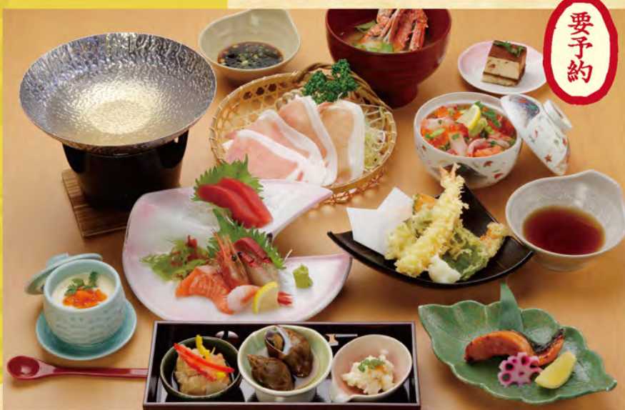
90 黒豚コース 4,000円(税込み)