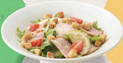
65 シーザーサラダ 780円