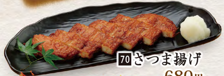
70 さつま揚げ 680円