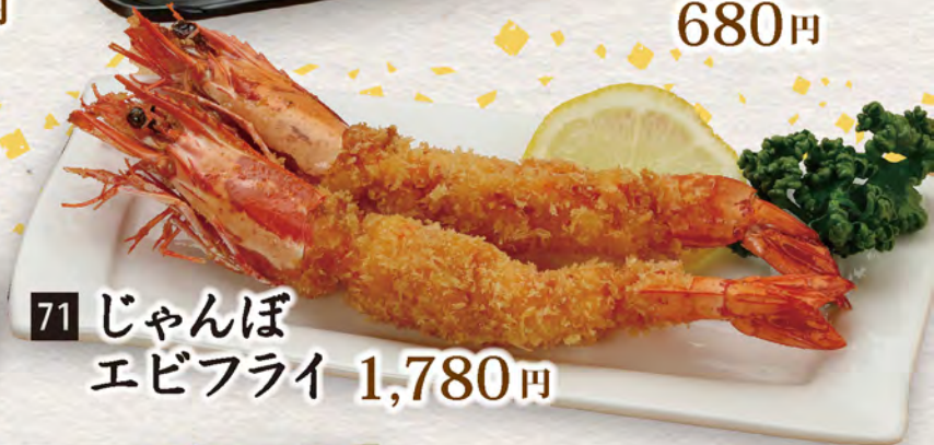
71 じゃんぼ エビフライ 1,780円