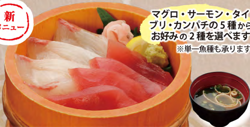
選べる海鮮 二色丼 1,680円 みそ汁付き

マグロ・サーモン・タイ ブリ・カンパチの5種から お好みの2種を選べます ※単一魚種も承ります