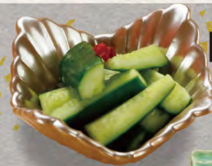
77 きゅうり浅漬け 280円