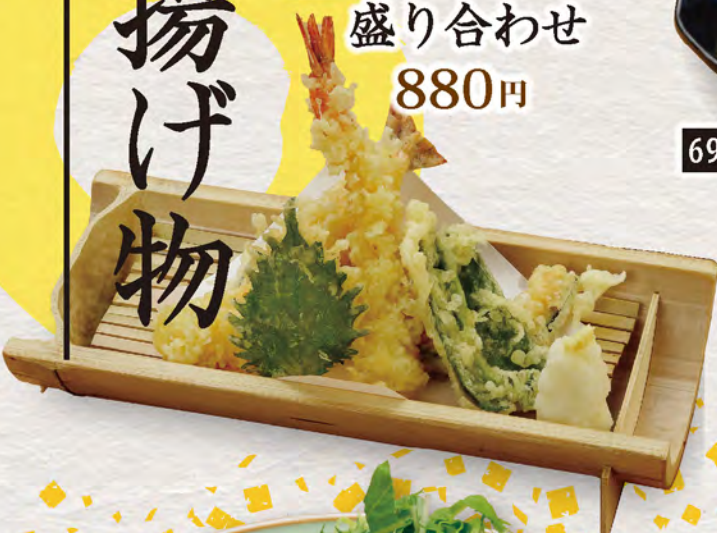
68 天ぷら 盛り合わせ 880円