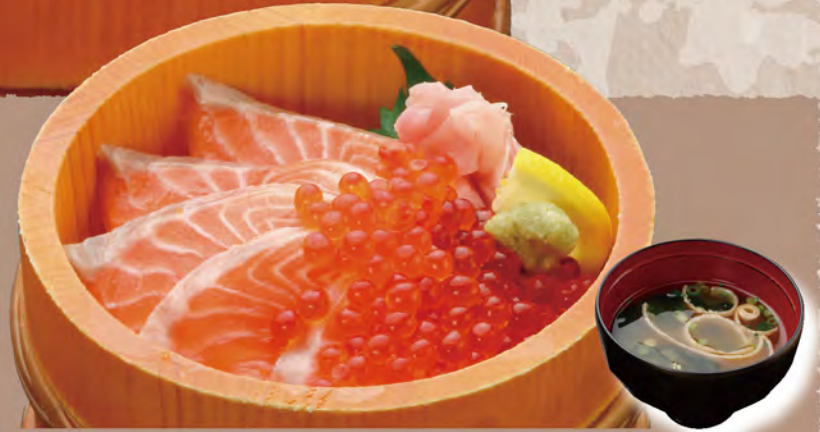
サーモンイクラ丼 2,580円 みそ汁付き