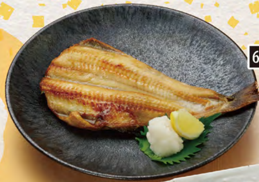
66 ホッケ開き 焼き魚 980円