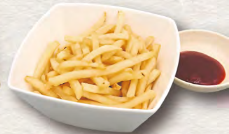
74 ポテトフライ 380円