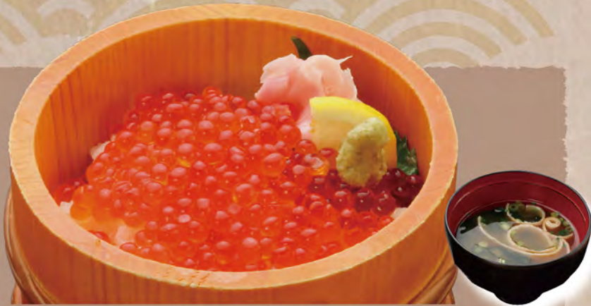
イクラ丼 2,980円 みそ汁付き