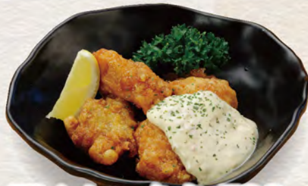
69 チキン南蛮 780円